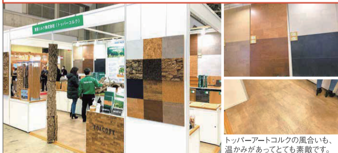
トッパーアートコルクの風合いも、温かみがあってとても素敵です。

環境にやさしい建材といえばコルクです。その理由が「炭素固定化」。「炭素固定化」とは、二酸化炭素(CO2)を別のものに変えることで、植物の「光合成」も分かりやすい例と言えます。コルク樹皮の採取後、通常の3~5倍のCO2を吸収しながら再生し、繰り返し15~20回も採取できます。改めて持続可能なエシカル建材として注目が集まっています。