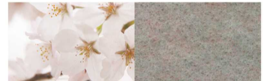
品番:L-23「Misty Sakura (ミスティー・サクラ)」