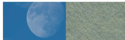
品番:L-30「Moonlit Blue (ムーンリット・ブルー)」