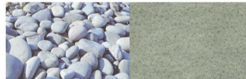
品番:L-17「Foggy Grey (フォギー・グレイ)」