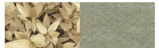
品番:L-46「Smoky Coyote (スモキー・コヨーテ)」

仕様・規格 ポリプロピレン100% 巾:91cm/182cm 長さ:スタンダード-25m